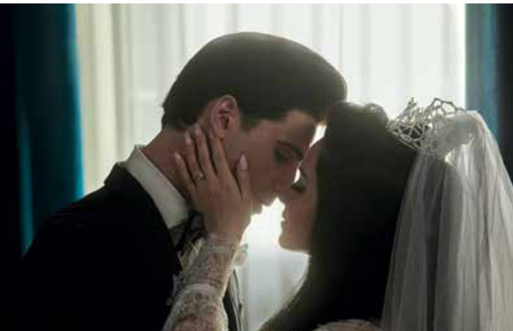
Jacob Elordi e Cailee Spaeny in “Priscilla”