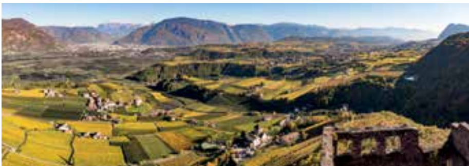
Il Programma di sviluppo vuole garantire un futuro sostenibile al nostro comune