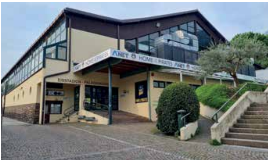
La sostituzione dell'impianto del ghiaccio non è più rimandabile

In generale, il caso dello stadio del ghiaccio di Appiano dimostra che una pianificazione accurata e una comunicazione trasparente sono essenziali per tutelare gli interessi dei cittadini e garantire la salute finanziaria del Comune a lungo termine. Dal 26 aprile al 7 giugno è in vigore la regola della par condicio riguardante le elezioni del Parlamento europeo. Durante questo periodo non potremo pubblicare articoli sul Notiziario Comunale, tuttavia non rimarremo con le mani in mano e continueremo a informarvi tramite i nostri canali social.