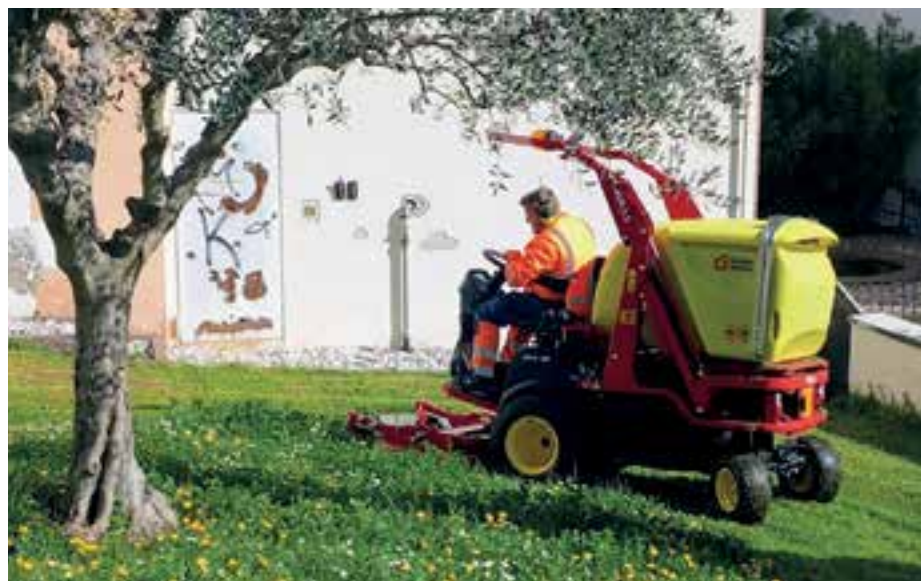
Il nuovo trattorino tagliaerba permette di lavorare in modo più rapido ed efficiente

L'area di servizio ambiente e infrastrutture